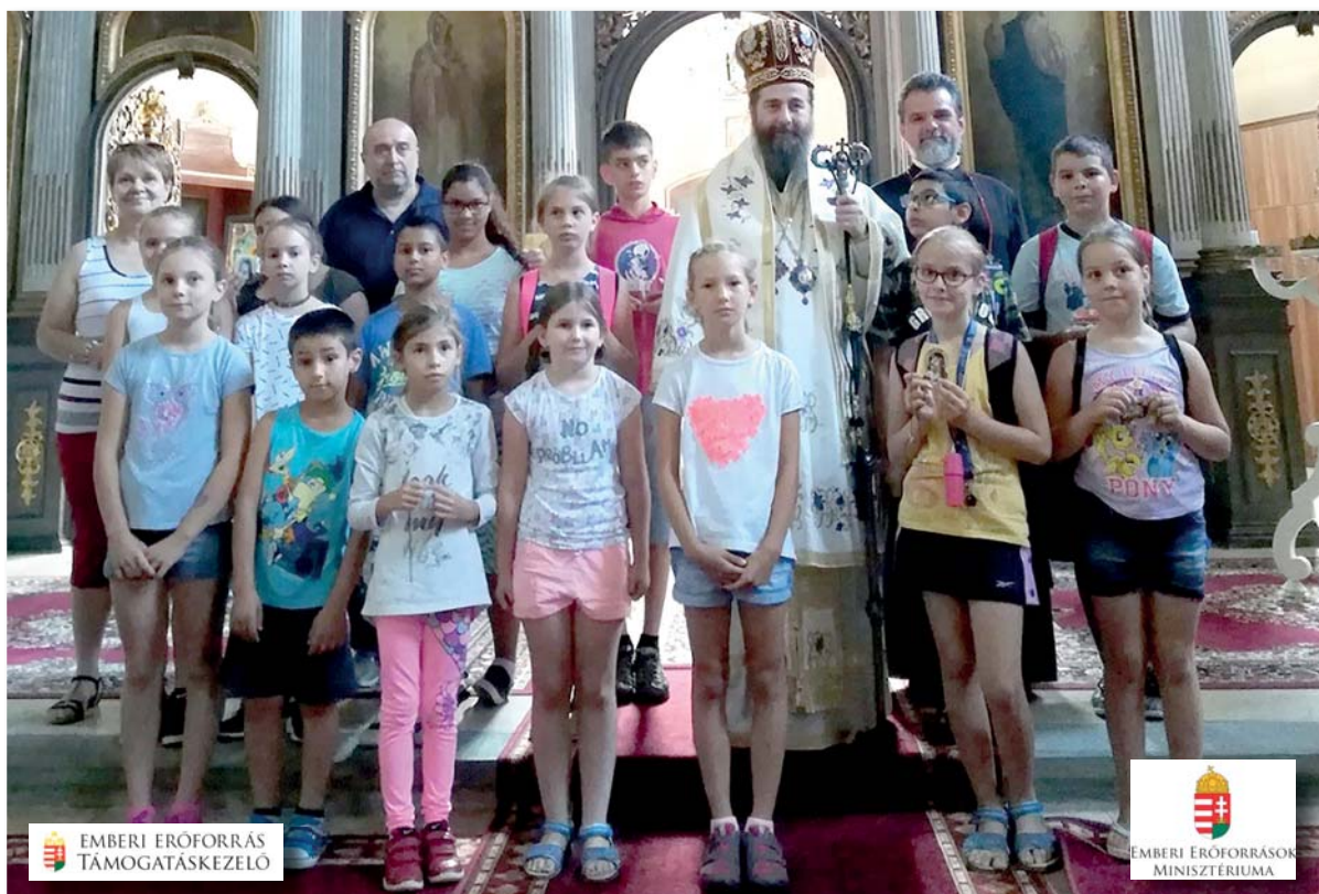
EMBERI ERŐFORRÁS TÁMOGATÁSKÉZELŐ